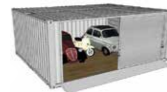
Container doppio adibito a ricovero auto con chiusura frontale scorrevole

Container mt 12 e 6 x 2,45 h 2,60 e 2,90 per magazzino pallet o ricovero materiali disponibili nella versione con portone scorrevole in acciaio o fornito con telo in PVC scorrevole tipo semirimorchio