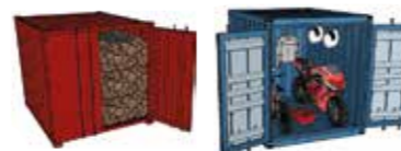
Container mt 3x2,45 h 2,60 per magazzino o ricovero attrezzi