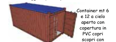
Container mt 6 e 12 a cielo aperto con copertura in PVC copri scopri con porte frontali utile per stoccaggio carta, plastica, legno, imballaggi misti e pneumatici per il successivo ritiro e smaltimento; può sostituire i tradizionali cassoni scarrabili

SOSTE A PIAZZALE • MAGAZZINO • TRASPORTO • SPEDIZIONI • LOGISTICA