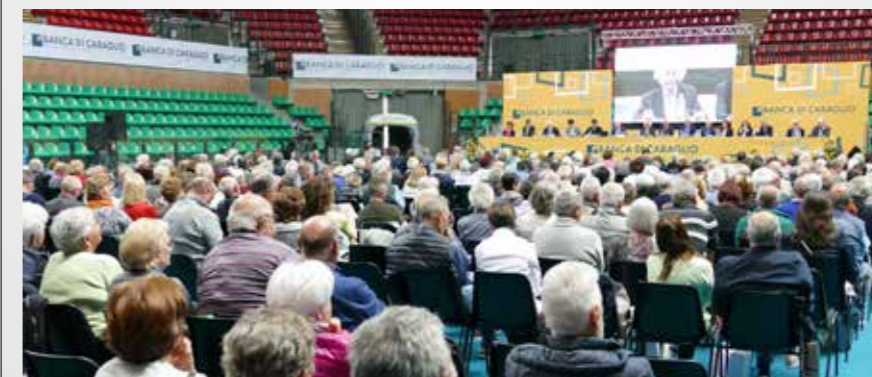
L'ultima edizione dell'Assemblea dei soci svoltasi il 5 maggio 2023 presso il Palazzetto dello Sport di Cuneo