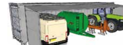
Container mt 12 x 5,30 x h 2,70 per ricovero mezzi agricoli ed attrezzature