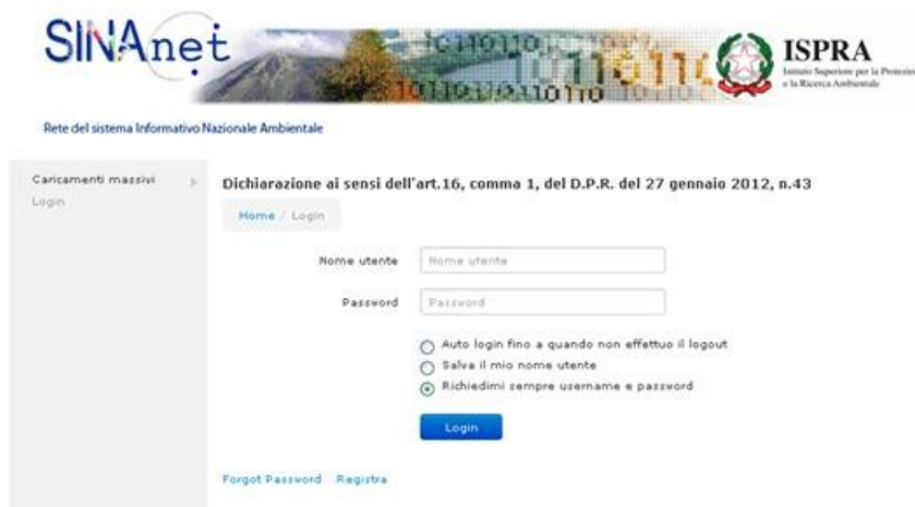
Figura 1. La pagina per accedere al sistema e per eseguire la registrazione degli utenti.

Il sistema visualizza la pagina di "login" vedi Figura 1.